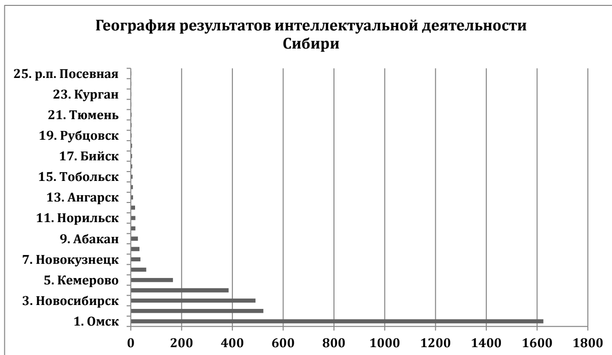
Рис. 3. География результатов интеллектуальной деятельности Сибири

География анализируемых результатов интеллектуальной деятельности представлена 36-ю городами из 113 городов Сибири, среди которых первое место занимают наукограды: Омск и Томск.