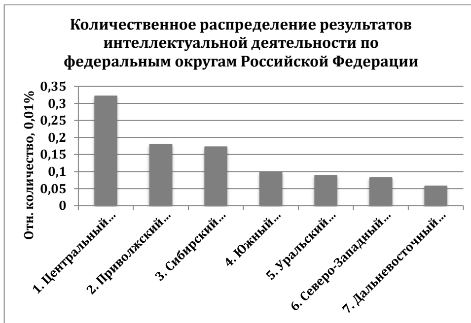
Рис. 1. Количественное распределение результатов интеллектуальной деятельности по федеральным округам Российской Федерации

сурсов «Наука и образование» представлены 7 федеральных округов со следующим количественным распределением результатов интеллектуальной деятельности: