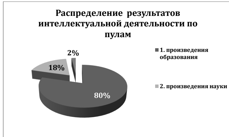
Рис. 4. Распределение результатов интеллектуальной деятельности – произведений – по пулам

науки, произведения образования, произведения поддержки государственного хозяйства, количественное распределение которых демонстрируется диаграммой 4 [3,4]: