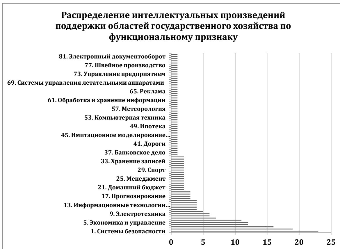
Рис. 8. Распределение интеллектуальных произведений поддержки областей государственного хозяйства по функциональному признаку

констатируем наличие 82 областей и отраслей государственного хозяйства, которые поддерживаются данными результатами интеллектуальной деятельности. Первые места в этом распределении занимают такие области, как «Системы безопасности», «Обработка информации», «Автоматика», «Здравоохранение» и «Транспорт».