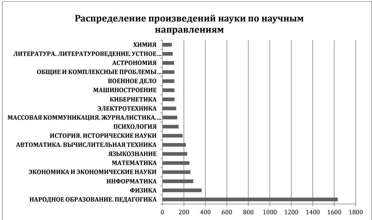
Рис. 7. Распределение произведений науки по научным направлениям

Диаграмма наглядно демонстрирует преимущество научных исследований (фундаментальных и прикладных) в области образования и педагогики в соответствии с главной задачей университетов региона – подготовкой новых кадров.